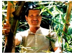
Thành Xô mùa xuân 2019