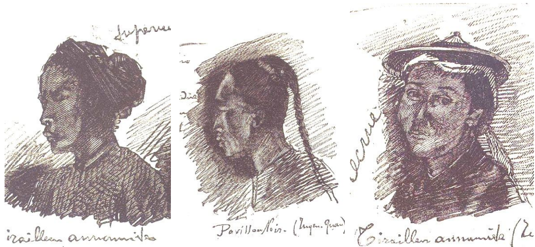
Hình vẽ lính chiến Việt và quân Cờ Đen của Bobillot