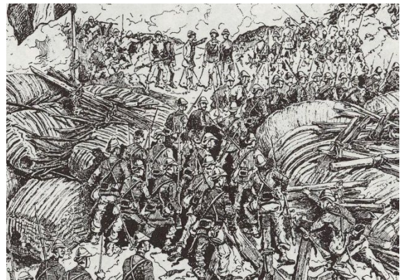
Giao chiến ở Tuyên Quang (Tranh dân gian)

May còn có bài thơ của Raymond Queneau (1967) nhắc nhở đến tên Bobillot: