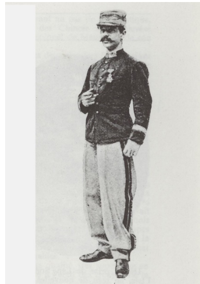
Hình vẽ Bobillot trên một tờ quảng cáo ảnh Trung sĩ Bobillot