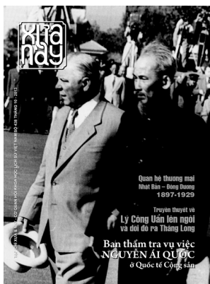
Bìa 1: Chủ tịch đoàn Chủ tịch Xô viết Tối cao Liên Xô Kliment Voroshilov đón Hồ Chủ tịch tại Matxcova năm 1955