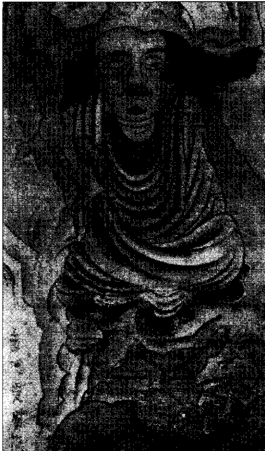
KOUAN HIU (830-912); La Hán, tranh lụa