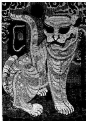
Bạch Hổ , tranh thờ Hàng Trống (75x55 cm)

Nói về những khác biệt giữa ba nền tranh khắc gỗ dân gian của Trung Quốc, Việt Nam và các dân