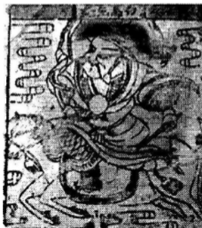
Bạch Mã Tiên Phong , tranh bùa Bắc Kinh (25,5x23 cm).

Ngược lại, trong nền tranh khắc gỗ dân gian Việt Nam, tranh chúc tụng và tranh châm biếm, nằm chung trong mảng tranh Tết , chiếm một địa vị khá quan trọng. Dòng tranh thờ Hàng Trống (tín ngưỡng Đông bồng) lại càng nổi bật, độc đáo.