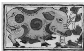
Lợn độc, tranh Đông Hồ

(4) Sách Trung Quốc nghiên cứu về tranh khắc gỗ dân gian đặc biệt về tranh Tết, có khá nhiều. Song, không phải cuốn nào cũng cùng mang một tinh thần khoa học, nghiêm túc. Tôi đã từng hơi bị ngạc