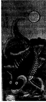
Cá chép trông trăng, tranh Hàng Trống

tranh Tết của Việt Nam : bức Lợn độc ( Lợn ăn lá dáy – tranh Đông Hồ) và bức Cá chép trông trăng ( Lý ngư vọng nguyệt – tranh Hàng Trống khổ lớn), rồi nói dựng đứng lên rằng bức Lợn độc là tranh đời nhà Thanh, của một dân tộc ít người tỉnh Quảng Tây, hiện còn lưu giữ ở Phủ Trấn, Quảng Đông ; còn tranh Cá chép trông trăng cũng thuộc đời nhà Thanh, sản xuất ở Giang Liễu Thanh, Tiên Sinh, Hà Bắc. Điều không thể chấp nhận được là tác giả đã không sao lại nguyên bản hai bức tranh ở Quảng Đông và Hà Bắc (nếu có), mà lại ngang nhiên sử dụng hai bức tranh của Việt Nam, rồi để ở bên dưới : “ a Hanoi reproduction ” ! Thật là hết ý ! Đầu sao cũng chỉ có hai giả thiết : một là tác giả đã