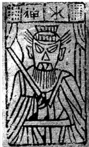
Thủy Thần , tranh bùa Trung Quốc (19,5 x 13,5 cm), Khai Phong, Hà Nam.

Với sự xuất hiện của các tôn giáo và các triết thuyết cổ đại, thêm vào đó, sự phát triển của sản xuất và của các ngành nghề trong xã hội, dần dần hình thành các loại tranh thờ có nội dung phức tạp hơn, cũng như các loại tranh chúc tụng và tranh Tết , với hình thức tươi vui, phong phú hơn.