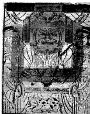
Ngưu Vương Chi Thần , tranh thờ Trung Quốc, Bắc Kinh (31x25cm).

Ngoài ra, dựa theo các tài liệu lịch sử, người ta biết rằng, dưới đời nhà Tống (960-1279), do thương mại và thủ công nghệ phát triển, nghề làm tranh cũng rất phát đạt. Theo Vương Thụ Thôn, tác giả cuốn Trung Quốc Cổ Đại Dân Tục Bản Hoạ : “ Vào dịp lễ Thanh minh, đường phố tràn ngập những tranh bùa, trông như những cánh bướm ”, “ đến Tết Nguyên Đán, các nghệ