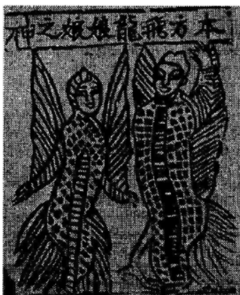
Bản phương phi long nương nương chi thân, tranh bùa (12,5x11 cm), dân tộc Đại Lý, Vân Nam (Tiên minh rồng có cánh, được dân thuyền chài vùng này thờ làm thần hộ mệnh). Tài liệu: Vương Thụ Thôn, Trung Quốc Cổ Đại Dân Tục Bản Hoạ, NXB Tân Thế Giới, Bắc Kinh, 1989.

Nhưng làm sao mà biết được cái dĩ vãng xa xưa kia của