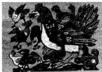
Gà Đàn , tranh Đông Hồ (40x30 cm)

Đây chủ yếu là những tranh bùa vùng Đại Lý, Vân Nam, chỉ có nét đen, không có màu, khổ nhỏ ( từ 13x10 cm, đến 17x13 cm). Ở dân tộc Tày, vùng tây-bắc Việt Nam, có loại tranh