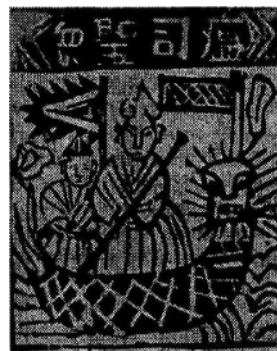
Ôn Ti Thánh Chúa (Thần Bệnh Dịch), tranh bùa dân tộc Đại Lý, Vân Nam.

Có hai khía cạnh cần được xem xét: khía cạnh kỹ thuật – nghệ thuật, và khía cạnh nội dung đề tài thể hiện những ý tưởng và nhu cầu của xã hội đương thời.