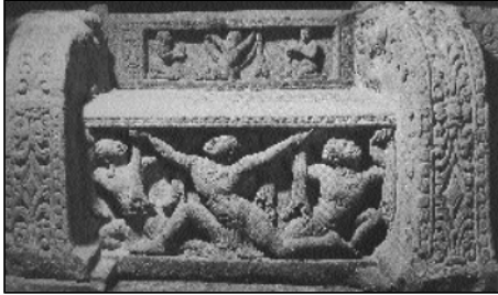
Bệ đá tại Mỹ Sơn, viện bảo tàng Chăm, Đà Nẵng