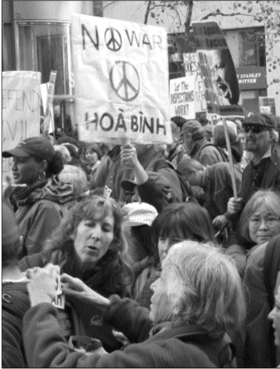
Biểu tình ở San Francisco 16.2.2003