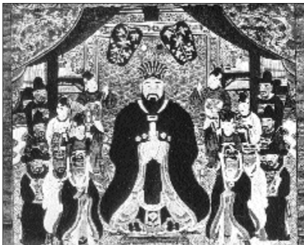
Vua Thượng Chàn

Lassamane (Laksamana, âm chữ Hán gọi là Lạc-ty-ma-na hoặc Lạc-tác-ma-na) gửi vua Lưu Cầu đề ngày 11 tháng 4, 1480 cũng có nhắc đến chuyện một chiếc thuyền Lưu Cầu cũng đã trôi giạt vào bờ biển Việt Nam. Trong thư có đoạn viết : “ Nhân nghe khi một trong những thuyền của quý quốc [Lưu Cầu] bị trôi giạt vào bờ biển nước Giao Chỉ [Việt Nam], thủy thủ vì thiếu nước uống mà đã phải đánh nhau với người Giao Chỉ, Lassamane đã gửi một chiếc thuyền nhỏ đến nơi trước đây là đất Chiêm Thành. Sau khi ra sức tìm kiếm, chúng tôi tìm thấy được 2 người, nhưng 1 người đã chết từ lâu vì mắc