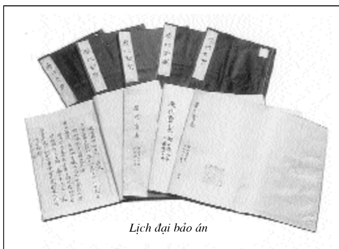
Lịch đại bảo án

Nếu chỉ tính riêng Đông Nam Á (tiếng Lưu Cầu gọi chung