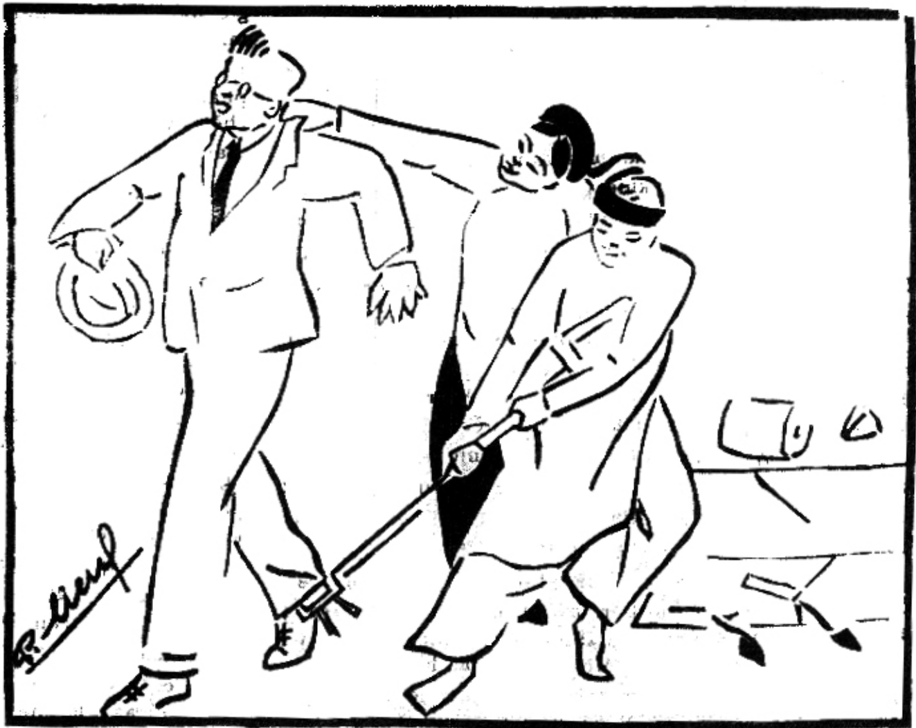
Thần hồn kia đã trở hai ... Nàng còn cầm lại một hai tự thò ...

đánh bạo búa lảng vào làng vải. Trước còn đóng vai tài tử, sau học thụ nhà nghề. Vải chương bầy tụy không được nhờ nhờ châu ngọc hàng hàng gấm thêu nhưng không đến nỗi nước lã ao bèo chi duềnh đoảng. Nhưng thầy đời vải sỹ tay « bả » tay « giới » vẫn buồn, buồn vì nỗi trong trốn lao-tù có nhiều cảnh đáng thương tâm.