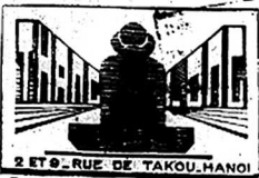
2 ET. RUE DE TAKOU HANOI