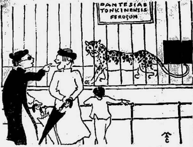
- Giữa cơn lũ này, nó biết nói thì không biết nó nói cái gì? - Nói cái gì? nó nói: ngừn nhảm, tôi là con Báo