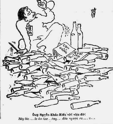
Ông Nguyễn-Khắc-Hiếu với việc đời