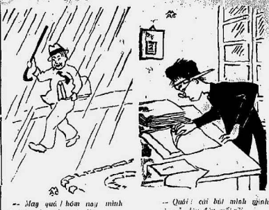
-- May quá hôm nay mình lại nhớ đến ông đi. -- Quái! cái bút mình quên viết ở đây đây mới rồi