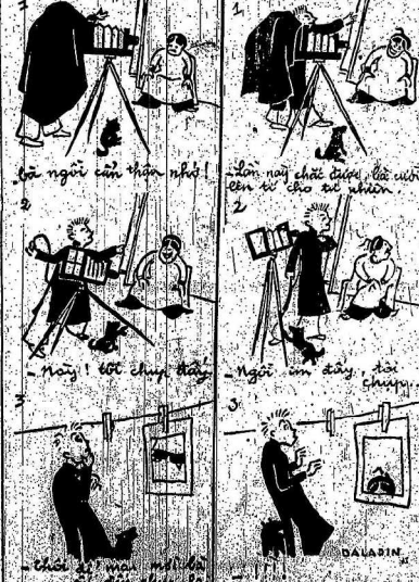
Chỉ cần một vài phút... Tôi thấy nó đi như sao?

Đàn hình mới và rất nhiều... Tôi thấy nó đi như sao?