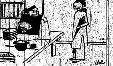
Chết thế nào được... Chết thế nào được... Chết thế nào được...