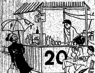
Cảnh phố ở Mỹ. Hàng hóa và nước chanh, nước đá. Ông là chủ hàng. Tôi không dám nói có sai.