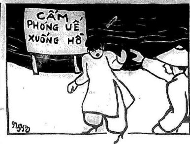
— Thay để mức tối, để lại lượng — — Đồ dùng riêng thể, nhưng thiên phổ độ để hình cam kia kìa —

Muốn hiểu rõ vấn đề này, xin các ngài đi tới giới thiệu những vấn đề trong truyện. Một là con khỉ, hai là cái bàn xoay, ba là sợi giây.