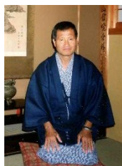
Thành Xô tháng 5.2019 trong mùa nhiều biến cố trên thế giới